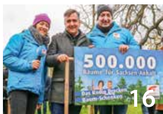
1 Million Euro für neue Bäume im Harz