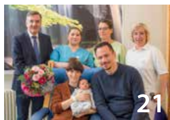
Harzklinikum feiert 1000. Geburt