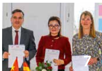
Kooperation mit Vietnam fördert Fachkräftegewinn